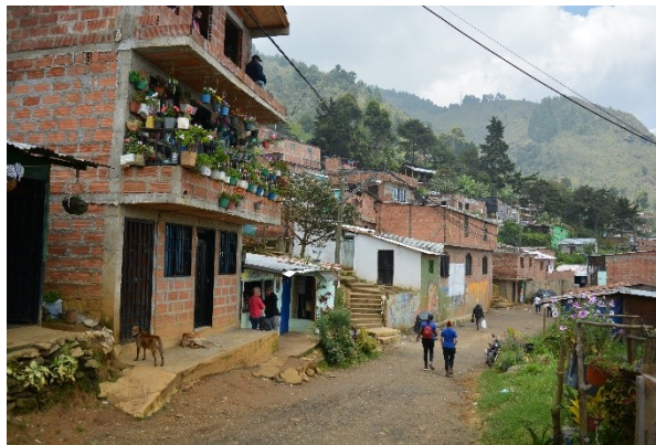
Caminando por el barrio.