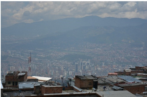
Vista desde el barrio.

Barrio Bello Oriente, comuna 3, zona nororiental de Medellín.