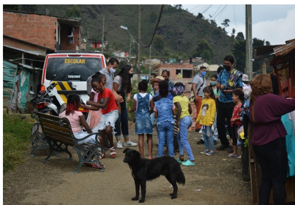
Preparando el escenario.

Llegó el Sainetur y se armó la fiesta del teatro con almuerzo de olla comunitaria para el vecindario. Un magnifico lugar para terminar el Sainetur, Sainetiando con la comunidad.